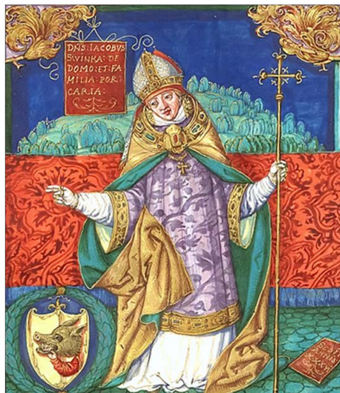
» Jakub Świnka, arcybiskup gnieźnieński, o iluminacji ksiąg przed 1535 rokiem

Ostatecznie Jakub Świnka zdecydował się zerwać całkowicie z polityką proczeską, wytaczając – może już w 1302, a na pewno w 1304 r. – proces czołowemu stronnikowi Wacława II, biskupowi krakowskiemu Janowi Muskacie. „Stan napięcia w Małopolsce obrazują liczne egzekucje. Wojska Muskaty wykonywały wyroki ścięcia lub wylupienia oczu. Represje te dotykały ludzi wszystkich stanów. [...] Do zamków biskupa zwożono łupy z kościołów, klasztorów i majątków szlacheckich” – pisał Baszkiewicz. Muskata nie ukrywał, że chce „ziemię, lud i język polski zniszczyć i zniweczyć”. Gdy czeski król Wacław II koronował się na króla Polski, późniejszy zjednoczyciel królestwa Piastów – Łokietek był wygnanym i tułaczem. Łokietkowi pomogła jednak w odwołaniu biegu dziejów śmierć Wacława II, a wkrótce potem zamordowanie jego następcy Wacława III.