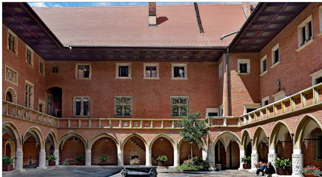
» Uniwersytet Jagielloński, dziedziniec Collegium Maius, ul. Świętej Anny 8, Stare Miasto w Krakowie

W czasach I Rzeczypospolitej wśród absolwentów uczelni znaleźli się ludzie kultury, nauki, duchowni, politycy oraz władcy, m.in. astronom Mikołaj Kopernik